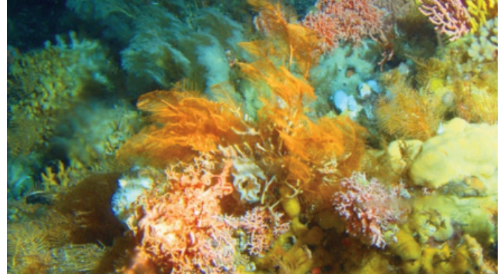
Korallen und Schwämme im kalten Wasser der Tiefsee sind keine Seltenheit, wie hier vor Alaska

Mittlerweile schätzen Forscher die Diversität in der Hoch- und Tiefsee auf ca. zwei Millionen Arten. Eine Zahl, die sich mit der Artenvielfalt in den tropischen Regenwäldern messen kann und diese wohl noch übertrifft. Viele dieser Arten sind endemisch, d.h. sie kommen nur an einzelnen Orten und nirgendwo anders auf der Welt vor. Besondere Biotope der Tiefsee sind zum Beispiel Unterwasserberge, die so genannten Seamounts. Obwohl bisher erst 1% der bekannten Seamounts wissenschaftlich erforscht wurde, wissen wir von ihrer ökologischen Bedeutung. Aufgrund der aufsteigenden Meeresströmungen sammelt sich an den Seebergen Plankton an, welches die primäre Nahrungsquelle für viele marine Lebewesen darstellt, die diese Orte gezielt als Jagd- und Laichplätze aufsuchen. Auch viele kommerziell genutzte Fischarten, wie Granatbarsch, Blauleng, Spiegel-Petersfisch und Schwarzer Degenfisch leben zum Teil in dichten Schwärmen an den Seebergen. In strömungsreichen Regionen findet man an ihren Hängen sogar bis zu 8000 Jahre alte Kaltwasserkorallen und Schwämme. Aufgrund der extremen Umweltbedingungen wie Kälte, starker Wasserdruck und dem Fehlen von Sonnenlicht, laufen alle Prozesse in der Tiefsee, unterhalb von 800 Metern, langsamer ab. Die Arten bleiben kleiner, erreichen erst spät die Geschlechtsreife, zeugen nur wenige Nachkommen und können sehr alt werden. Aus diesen Faktoren resultiert auch das besondere Problem der sensiblen Tiefseebiotope: Durch die massiven Zerstörungen der