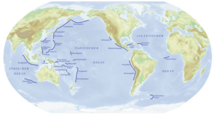
Karte der weltweiten Tiefseerinnen - die tiefsten Bereiche der Erde und ihre Verteilung

So erforschte das britische Expeditionsschiff "Challenger" von 1872 bis 1876 in allen Weltmeeren den Meeresboden und konnte über 4000 neue Tierarten entdecken. Mit dem Tauchboot "Trieste" gelang den berühmten Meeresforschern Jacques Piccard und Don Walsh erst 1960 der Durchbruch in der Tiefseeforschung: Sie tauchten im Marianengraben über 10.000 Meter ab und fanden selbst in dieser Tiefe noch Anzeichen von Leben.